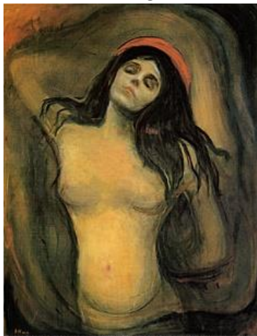
Edvard Munch, Madona (1894).

Considerando as informações presentes no Texto I e o exemplo do Texto II, indique a qual Vanguarda europeia a imagem pertence.